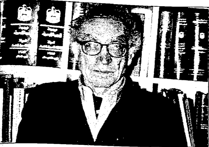
جان بول شارنيه